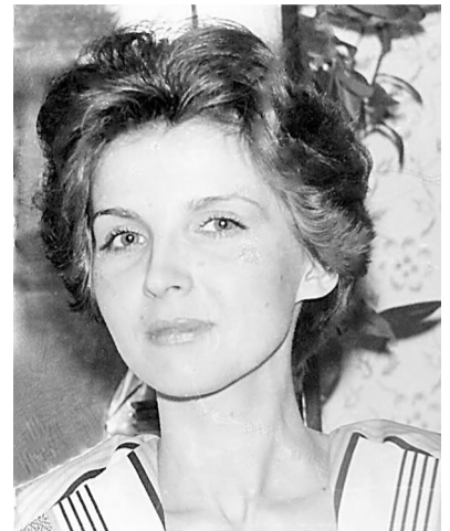
■ Несколько стихотворений, вошедших в книгу, сейчас читаются как пророческие для их автора.

По вопросам приобретения книги обращайтесь в городскую библиотеку, а также по телефону: 8-951-608-02-93.