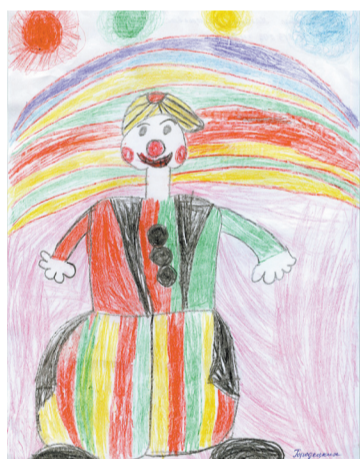
Ульяна Городецких, 6 лет.