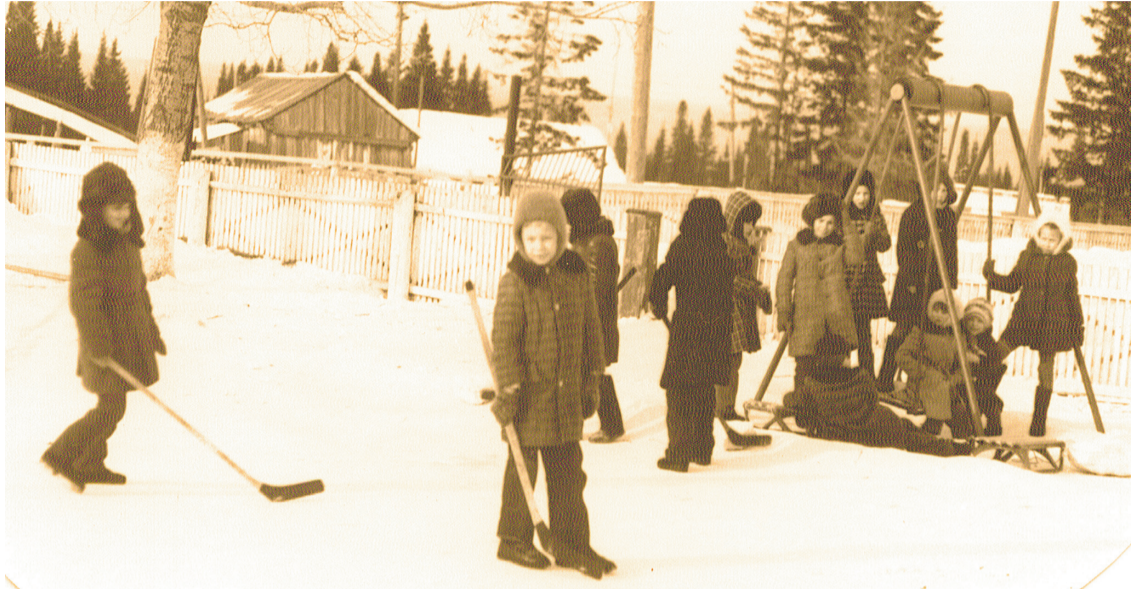
■ С момента открытия санатория взрослые постарались сделать так, чтобы дети не чувствовали себя одиноко, несмотря на длительную разлуку с семьей.

– Родители, приезжающие в санаторий к своим детям, не могли нашим воздухом надышаться, нашей водой напиться!