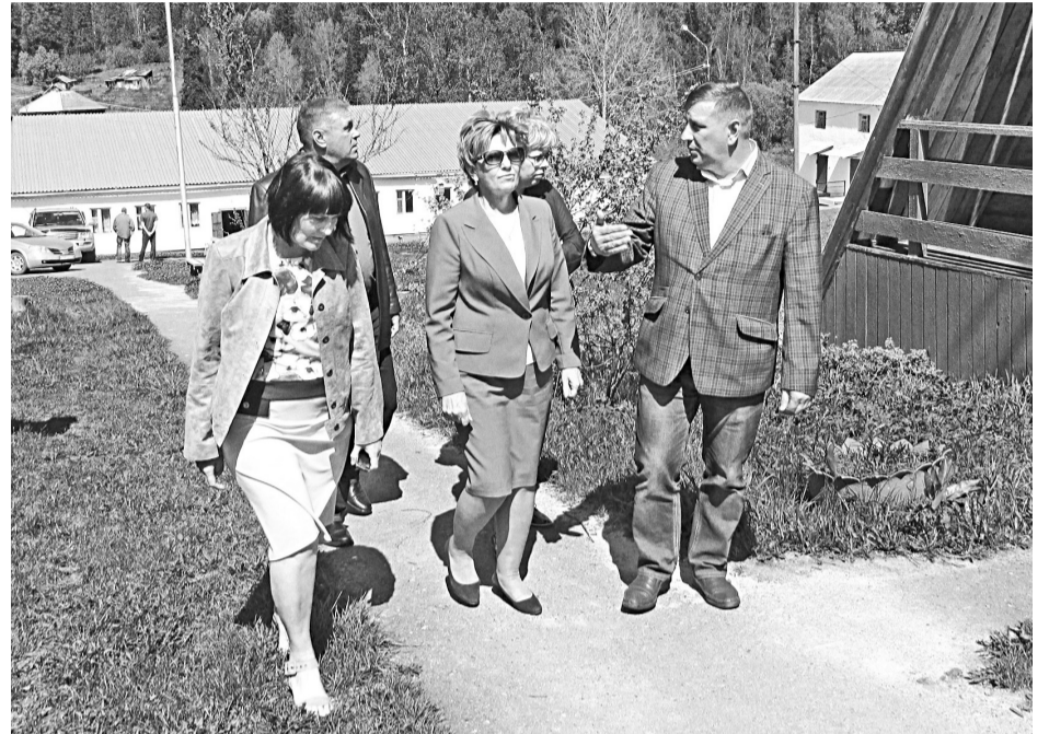
■ Загородный лагерь «Орленок» готов к приему отдыхающих.

ны финансовые лимиты на капитальный ремонт «Ласточки».