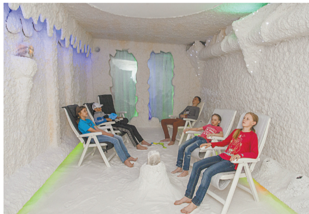
■ Под шум прибора из скрытых от глаз динамиков, сорок минут в «пещере» пролетят незаметно.

– Галотерапия (от греческого «hals», соль) – это немедикаментозный метод воздействия на организм человека, основанный на использовании воссозданного микроклимата подземных соляных пещер, – рас-