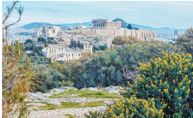
■ Вид на знаменитую гору Акрополь, где находятся архитектурные сокровища Древней Греции, включая Парфенон и храм богини Афины, относящийся к V веку до н.э.

и мыслей. Несмотря на то что Анна освоила греческий язык, это позволило ей продублировать свое педагогическое образование в другой стране, но научиться мыслить на другом языке она пока не может.