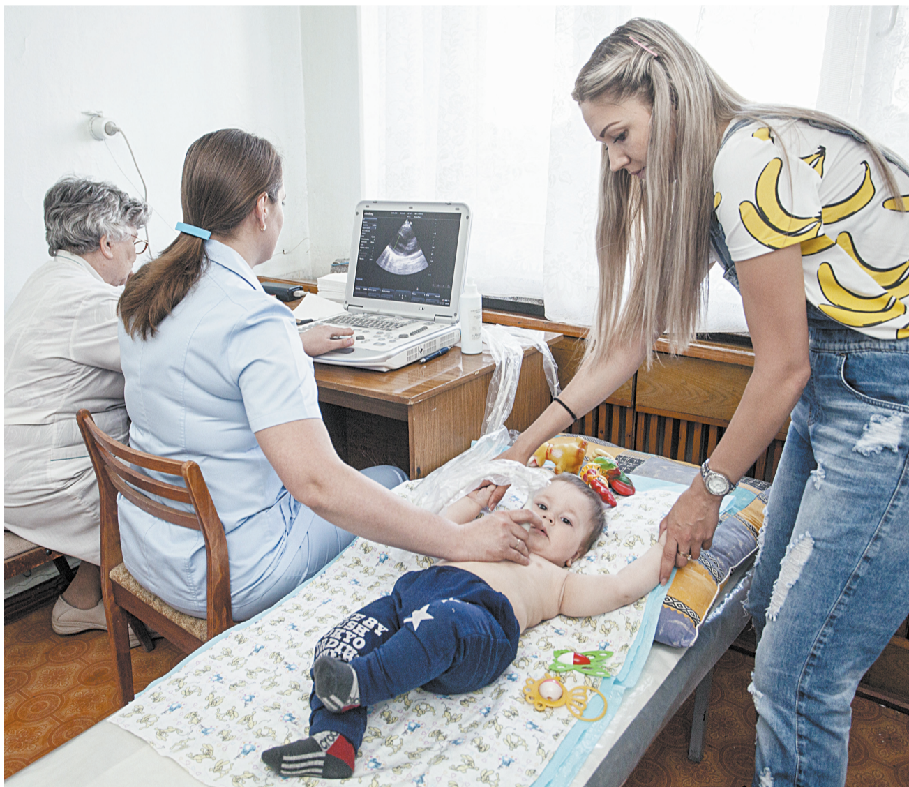
■ За один день работы в Берёзовском кардиологи приняли 20 маленьких пациентов.