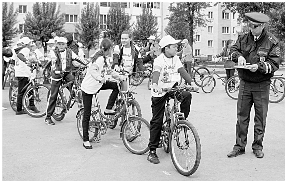
■ Прохождение этапа каждым участником инспектор фиксировал специальной карточке.

– Эх, поторопился, не заметил разметку на «змейке». Сейчас точно штрафные влепят! – с сожалением делился с товарищами после прохождения трассы Никита, участник одной из команд. – Зато как я «качели» проскочил! Видели? «Качели» на дистанции вызвали слож-