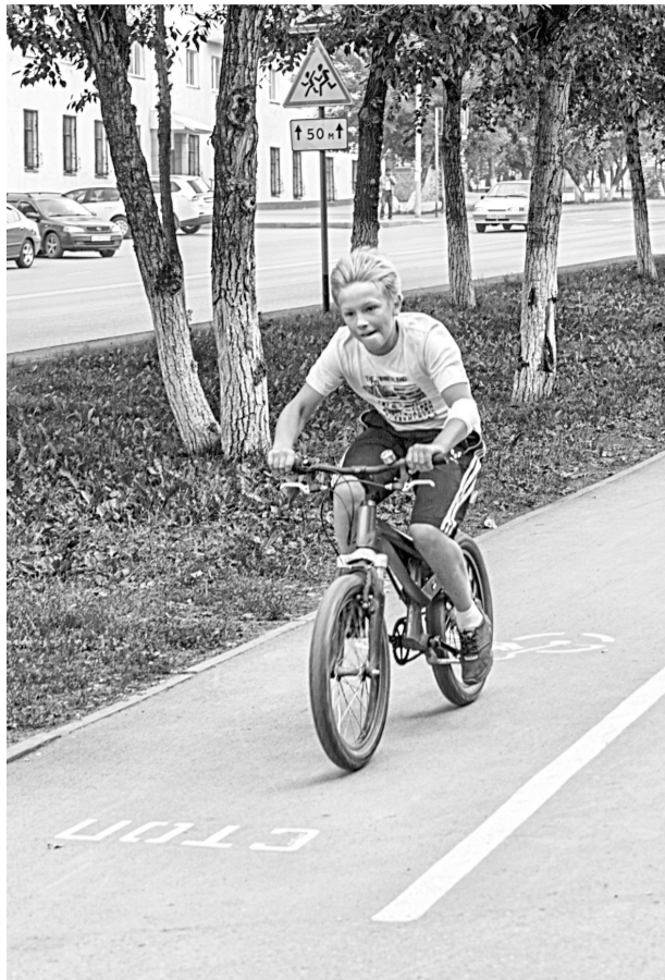
■ Во время движения велосипедист становится водителем, поэтому он должен соблюдать ПДД и передвигаться в предназначенных для этого местах.

Дороги предназначены для автомобилей, тротуары – для пешеходов. О том, где можно и нельзя двигаться велосипедом, рассказал инспектор направления по пропаганде безо-