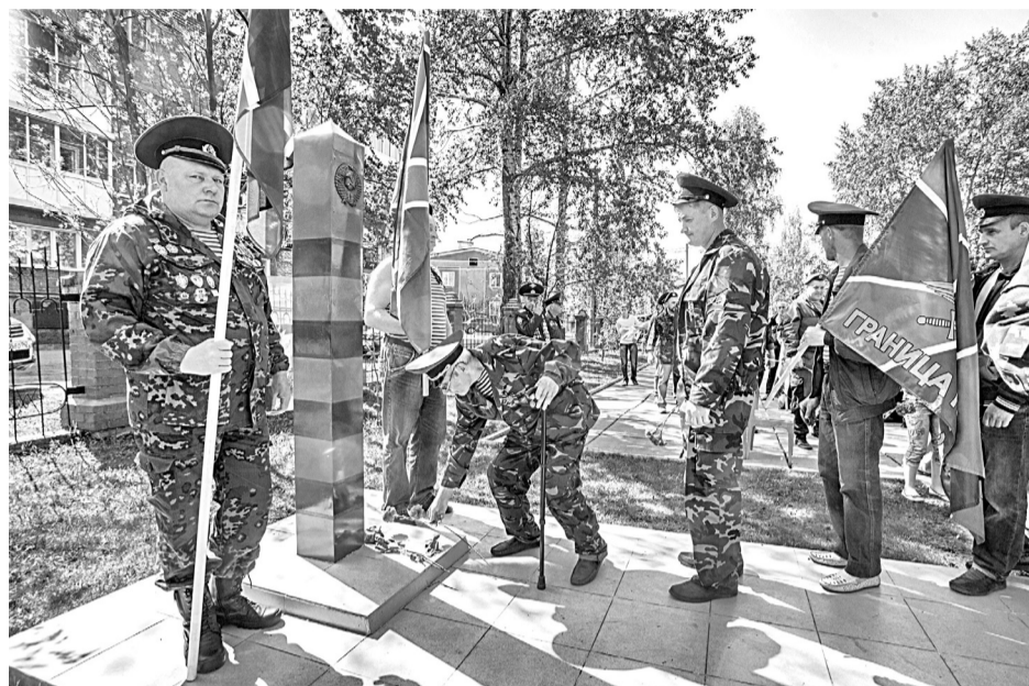
■ Программа празднования Дня пограничника началась с возложения цветов к мемориалу «Пограничный столб» на площадке городского музея.