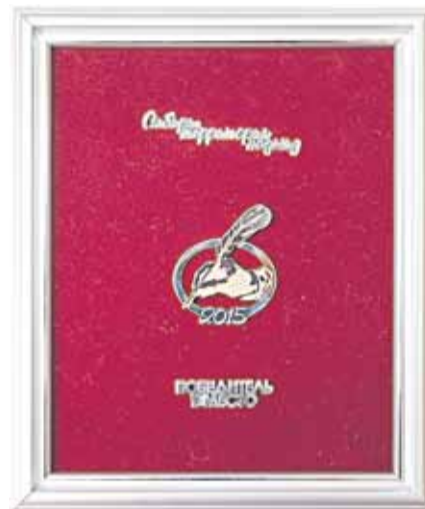
■ Серебряная с позолотой эмблема конкурса – приз за победу.