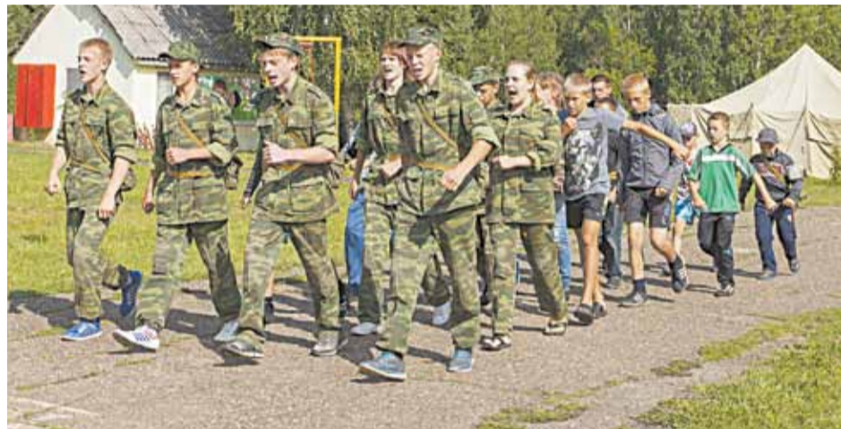
■ Первичные навыки строевой подготовки ребята освоили неплохо.