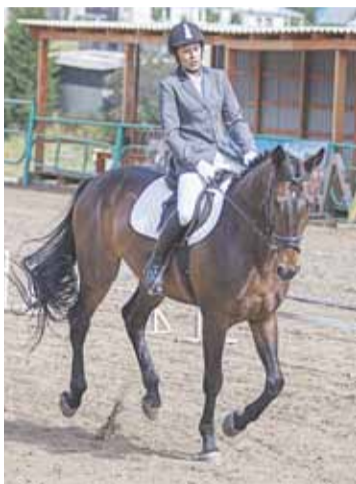
■ Начало соревнований в пятницу 31 июля в 11.00, в субботу 1 августа в 11.00. «Эндорон» расположен в поселке Федоровка на улице Высоковольная.