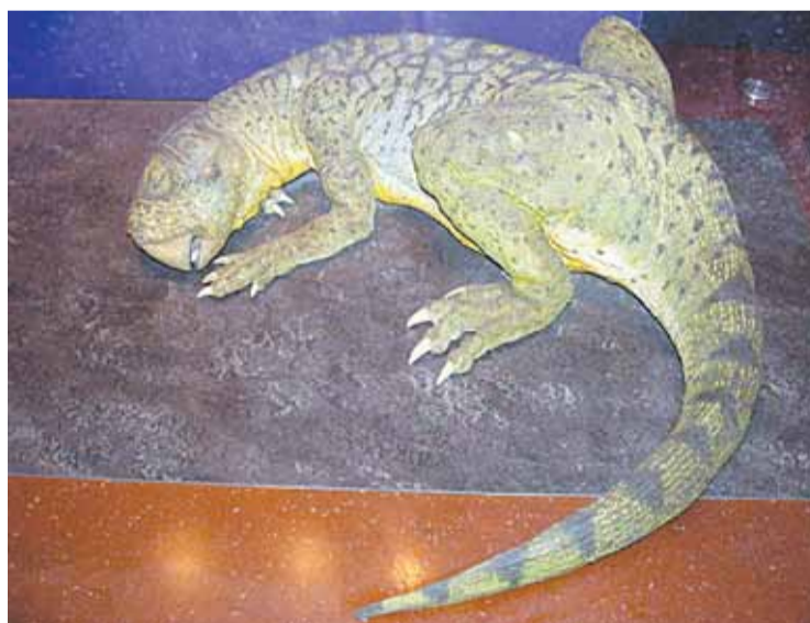
■ Таким представили пситтакозавра палеонтологи.

даже показал на месте, как ведутся раскопки, какими способами, с помощью каких инструментов.