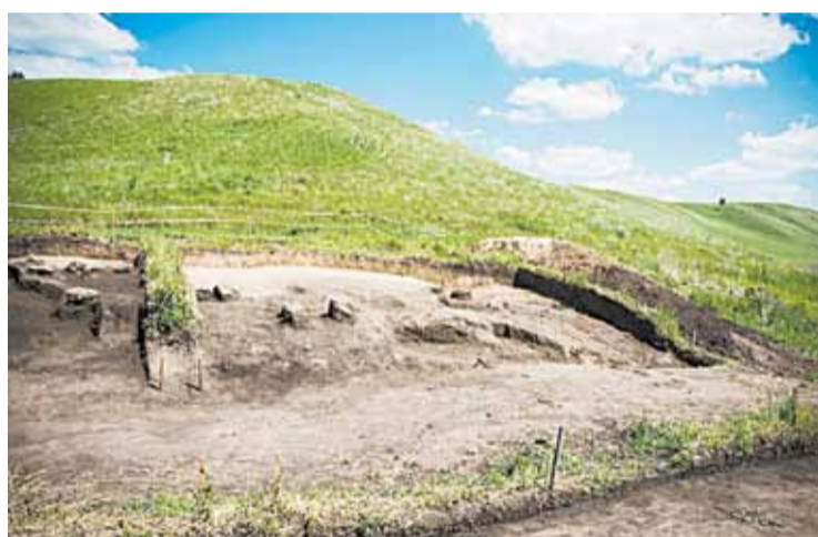
■ Еще один могильник, работа над которым только начинается.