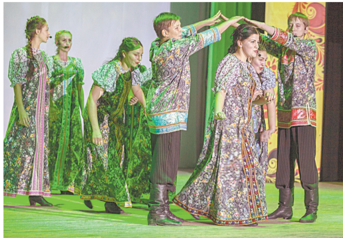
■ Концерт прошел на одном дыхании.

16 октября в ГЦТиД состоялось юбилейное торжество. Зрители получили большой заряд положительных эмоций и хорошего настроения. По окончании концерта было организовано чаепитие для коллектива и его друзей.