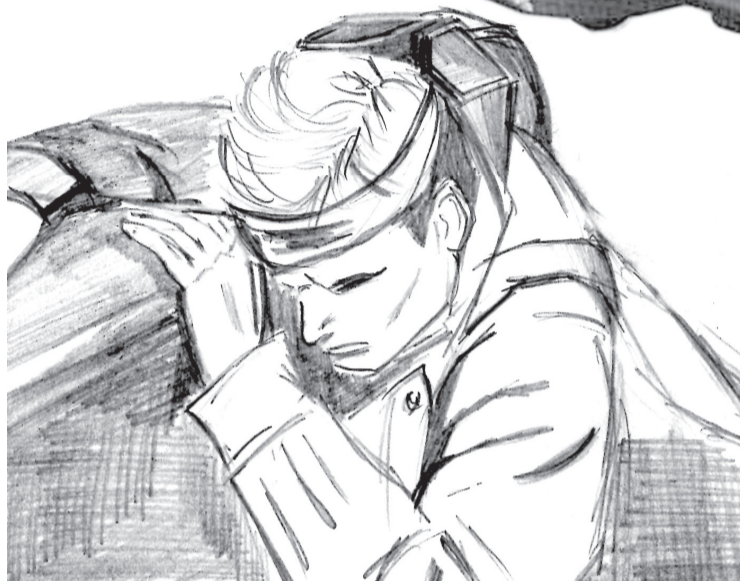
■ «Рухнувший самолет оказался нашим, советским. Подошли еще ближе, услышали стоны...».

же узнали, что его доставили в Горький, и больше мы не знали о нем совершенно ничего.