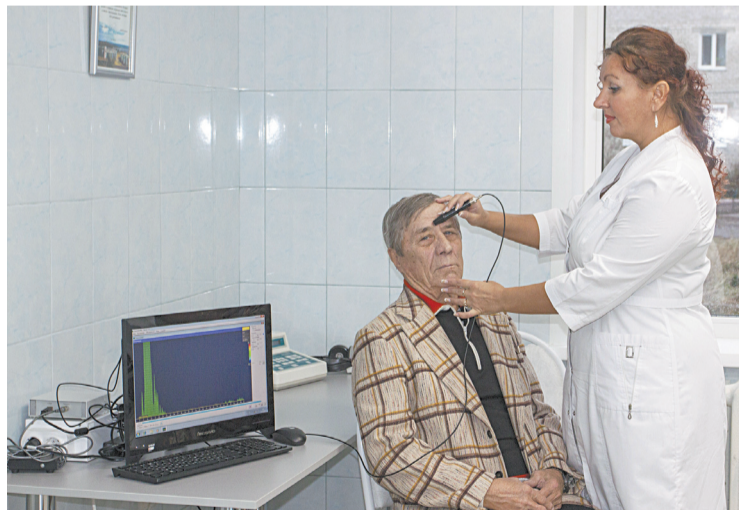
■ Использование экосинусоскопа делает ненужным рентгеновский снимок пазух носа и позволяет поставить точный диагноз сразу же на приеме.

Подтверждением сказанному становится первый же пациент, с которым мы знакомимся во вре-