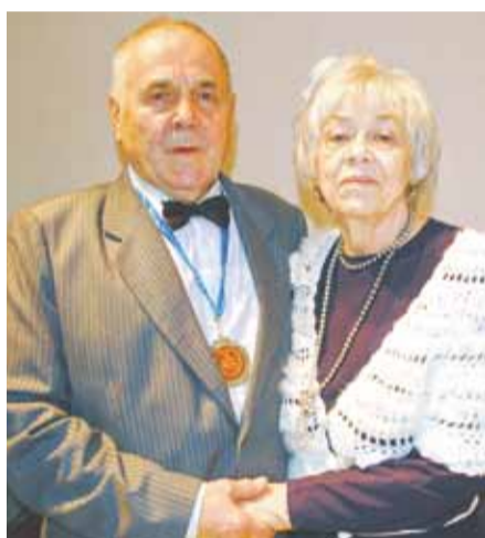
■ Совет да любовь!