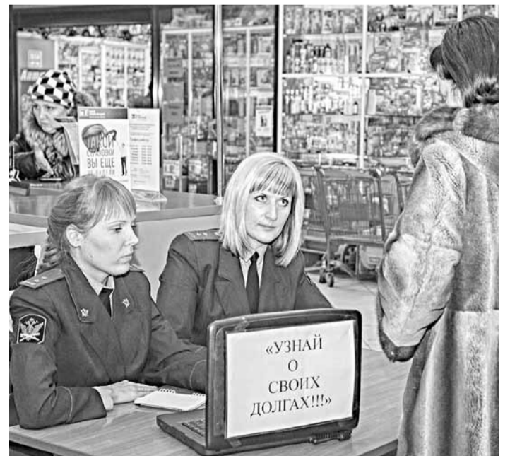
■ За несколько часов акции к приставам обратилось более пятидесяти человек. Из них трое оплатили счета на сумму около двух тысяч рублей.