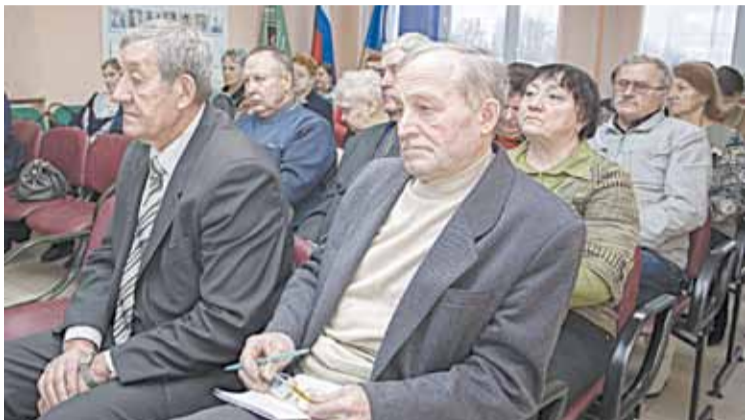
■ Взаимоотношения ветеранов с руководителями предприятий становятся продуктивнее благодаря постоянному общению.